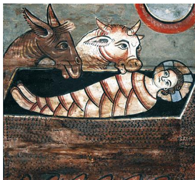
festett kazetta, Zillis: Jézus a jászolban

Ím lejött a Messiás, És hozott szabadulást.