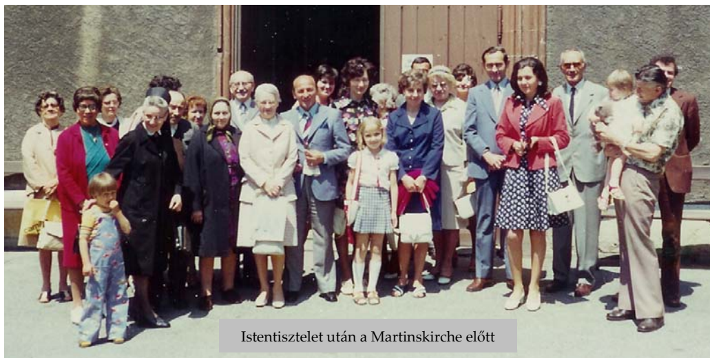
Istentisztelet után a Martinskirche előtt